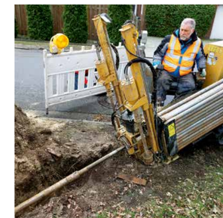
Anwendung des Spülbohrverfahrens