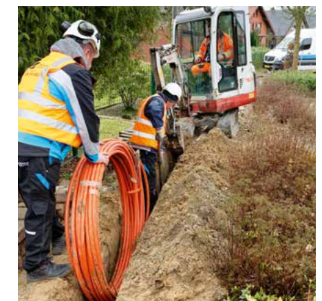
Klassischer Tiefbau per Minibagger