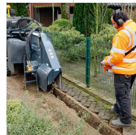
Der Mitarbeiter bedient die Fräse zum Ziehen des Grabens.

Egal welche Technik wir in Ihrem Ort verwenden: Sie können sich darauf verlassen, dass wir dank unserer jahrzehntelangen Erfahrung die – je nach Beschaffenheit des Untergrundes und der Gegebenheiten vor Ort – effizienteste Technik wählen, damit Sie so schnell wie möglich in den Genuss von reiner Glasfasertechnik kommen.